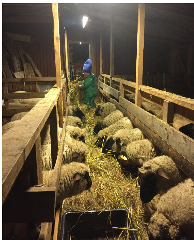
Tid for mat hos sauene på Østhus