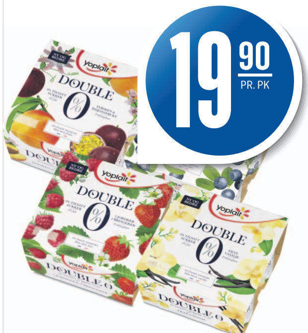
YOPLAIT DOBBEL 0% YOUGHURT 4-PK Utvalgte varianter, Fjordland, 4x125 g, 39,80 pr. kg