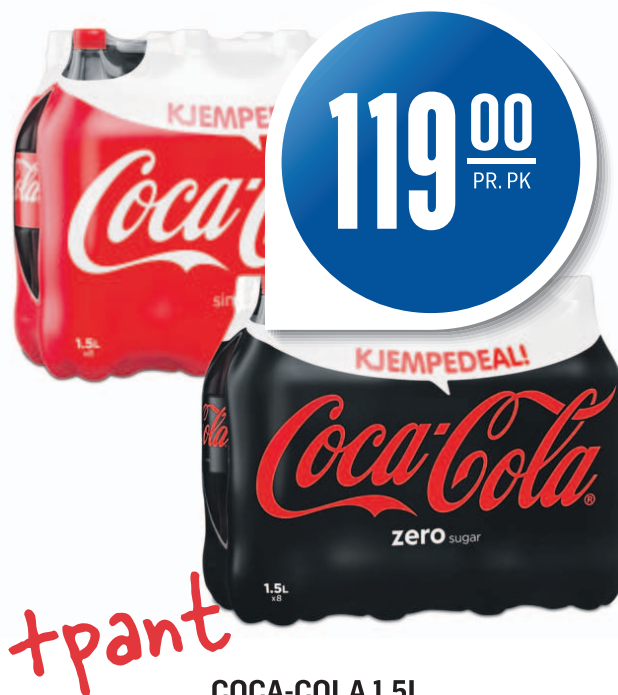
COCA-COLA 1,5L Coca-Cola, 8-pk, 9,92 pr. l

Gjelder Rogaland til og med 08.10.2016 - Kun til private husholdninger. Vi tar forbehold om eventuelle trykkfeil og at noen varer kan være utsolgt.