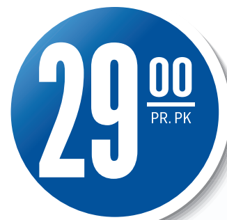
SKINNFRI KJØTTPØLSE Gilde, 900 g, 32,22 pr. kg