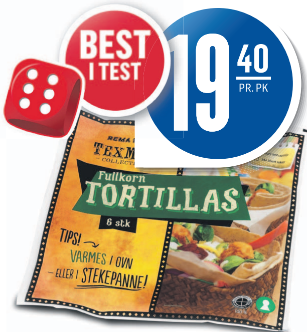
FULLKORNSTORTILLAS 6-PK REMA 1000, REMA 1000, 370 g, 52,43 pr. kg