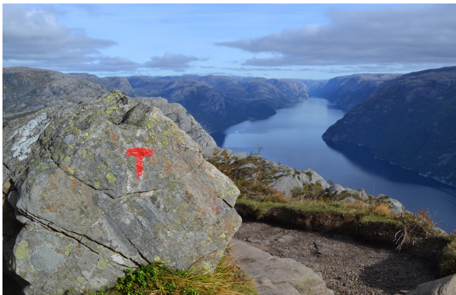
Preikestolen ser innover mot Lysefjorden.