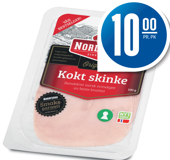
KOKT SKINKE Nordfjord, 100 g, 100,00 pr. kg