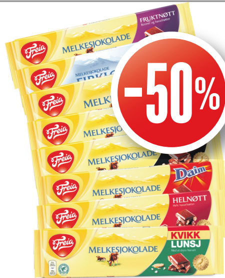
FREIA STORPLATER Mondelez, 200 g