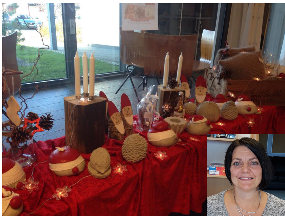
Julebutikken på Åkra.