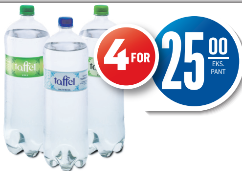
GRANS TAFFEL NATURELL/LIME/EPLE Grans, 1,5X4 l, 4,17 pr. l