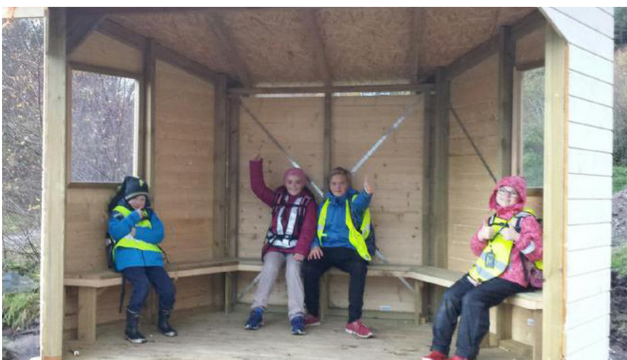
Nå kan skolebarna stå tørt når de venter på bussen i Haglandsle.