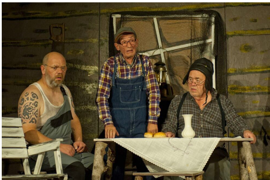
Brødrene Østermann er ikke sikre på om det var en god idé å få Anna til gårds.

på veggen. De vil ikke miste henne og alle tre frir i håp om at hun blir værende, men Anna er allerede forlovet med en staut kar fra Bokn.