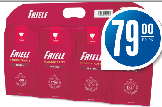
FRIELE FROKOSTKAFFE FILTER 4-PK Filtermalt, 4x250 g, 79,00 pr. kg

Gjelder i Rogaland til og med 24.12.2016 - Kun til private husholdninger. Vi tar forbehold om eventuelle trykfeil og at noen varer kan være utsolgt.