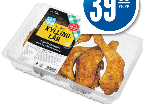
GRILLET KYLLINGLÅR Solvinge, 750 g, 52,00 pr. kg