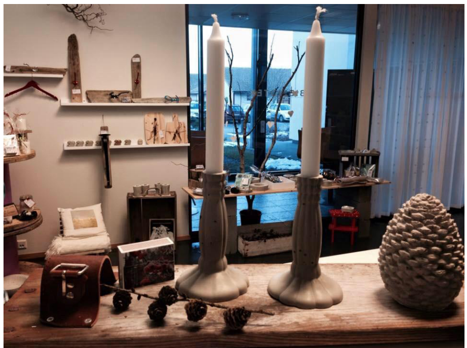
Mye fint i sement.

Omsetningen varierer fra år til år, sett i sammenheng med antall elever på hver gruppe og mestringsnivået deres. Dette skal først og fremst være en opplæringsbedrift. Det viktigste er at økonomien går rundt slik at vi kan fortsette driften hvert år, det er ikke noe big business dette. Vi har hatt overskudd hvert år og dette går tilbake til de flinke elevene våre. Vi har arrangert pizzabowling en gang pr år, noe som er kjemp populært. Vi har også hatt andre arrangementer for elevene, eksempelvis har vi et årlig arrangement (årets høydepunkt) hvor alle elevene i bedriften deltar. Vi låner da restauranten på skolen vår og dekker