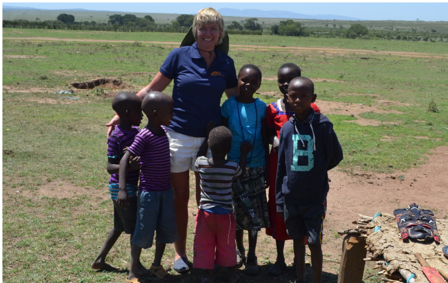
Besøk hos masai-folk