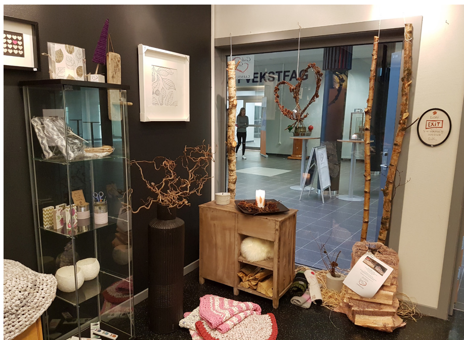
Utstillingskroken på Karmsund vgs.

variasjon på hvilke produkter som selges på de ulike skolene. Fellesnevneren er god stemning, god kvalitet og god service. Målet er at elevene skal være mest mulig involvert i de ulike oppgavene etter hvert som de lærer nye ting. Dette skal være opplæring og trening til fremtidig arbeid, blant annet ved å mestre ulike arbeidsoppgaver, utholdenhet og sosialt samspill.