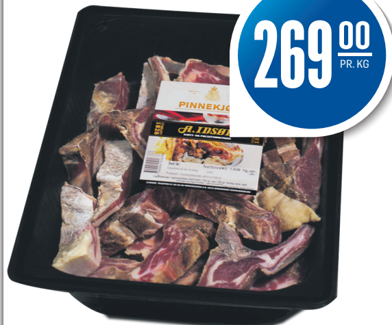
PINNEKJØTT A. IDSØE Idsøe, 269,00 pr. kg