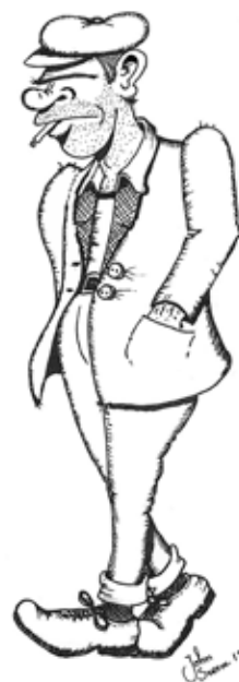
Gudvald Ognurnå illustrert av John Sverre Johnsen.