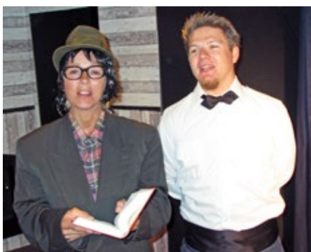
Snart klar til forestillinger i oktober.

Falkbergets stykke handler om nød, fattigdom og sult på stedet Mustrøa rundt 1920. Midt oppi all elendigheten iscenesetter Simen Mustrøen sin egen død, for at kjerring og sønn skal få mette sine skrikende mager. Løsningen blir gravølsmaten, som sambygdingene, etter gammel skikk, kommer med der sorgen rammer. Det går ikke helt slik Simen hadde tenkt og dette byr på forviklinger, sier revysjefen.