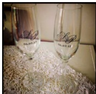
Tekst på glass.