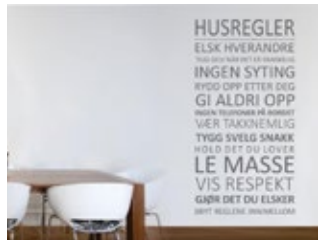
Tekst på vegg.