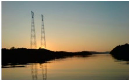
Dyrnesvågen før utfylling.

Det finnes mange andre firma som helt sikkert vil etablere seg i parken, det er allerede snakk om en petrokjemis fabrikk, Ølen betong har nylig åpnet et stor anlegg og Vassbakk og Stol har sikret seg plass i parken. Uansett om SAR eta-