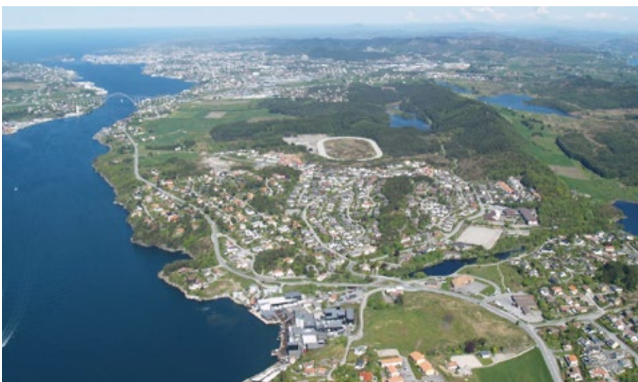
Nyere foto av Vormedal.

I neste utgave skal vi få høre mer om Vormedals Vannfald og hvilke planer de hadde for Vormedalselva.