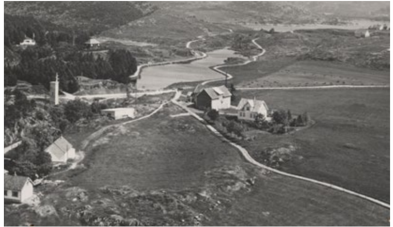
Vormedal, stemmen og vannet. Postkort fra 1954.