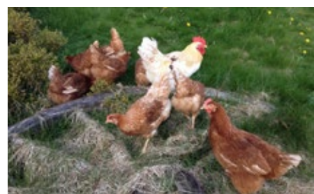
Hønene på Eagle Hill.