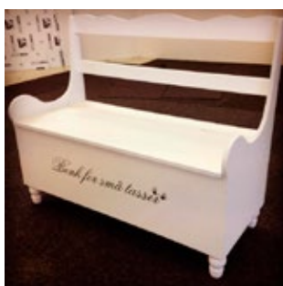
Restaurert liten slagbenk med tekst.

Alle er hjertelig velkommen til å ta en titt på jobber jeg har gjort på www.facebook.com/dekoroginterior