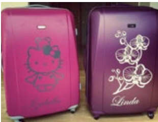
Folie på kofferter.