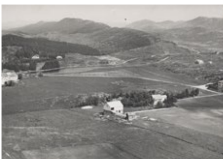
Vormedalsvannet. Postkort fra 1954.

Opprinnelig var Vormedal utmark og støl under prestegarden på Avaldsnes. Prestene sendte husmenn over Karmsundet til å drive stølsdrift og dyrke jorden. Garden var den gang en såkalt "Ødegård", en beskrivelse som ble gitt gårdsbruk som, av ulike årsaker, var blitt lagt øde eller forlatt (i Norge ble gårdene lagt øde først og fremst etter Svartedauden i 1349-1350). Den mest intensive gjenrydningsfasen av ødegårder i Karmøy var i årene mellom 1570-1630. Innenfor denne perioden ble flest gårder ryddet i løpet av 1570-1600 og noe i tiden rundt 1620.