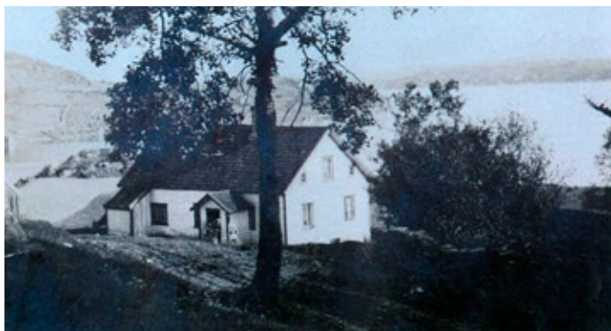
Våningshuset omkring 1920. Heilt til venstre kan me sjå litt av torvhuset. Det store treet midt i biletet er ei bjørk, til høgre kan me skimte eit lerketre.

Familien hadde to bærhagar, den eine på nordsida av huset, den andre ved eldhuset. Den søre hagen er minst og den blei brukt som kårhage (av kårfolket). I hagen blei det også dyrka litt grønsaker til eige bruk. Det blei også dyrka tobakk i hagen. Det var for dyrt å kjøpe, så det måtte dei ordne på anna vis. Hagen har ikkje vore i bruk på mange år, men bærbuskane har framleis bær. Dei høgvaksne bærbuskane i nedre kanten av Liå blei planta seinare.