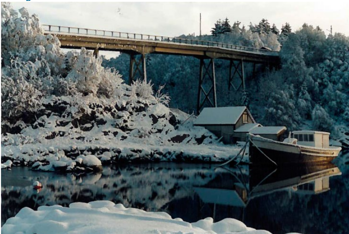
Røyksund bro med farger.

Det var tyskerne som sørget for at det ble bygget bro mellom Røyksund og Lindøy under andre verdenskrig.