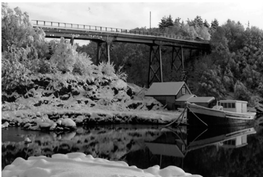
Samme bildet i svart og hvitt.

Broen ble overlevert til veimyndighetene den 30. mai 1941. (Kilde: HD 31.05.41) Til tross for at Røyksund bro gikk for å være en dårlig bro hvor arbeidet bar preg av hastverk, var den i bruk helt fram til 1995. Da ble den erstattet med en ny moderne betong-bro.