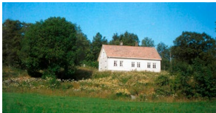
Same stad i år 2000. Me kjenner igjen det store tuntreet (ei bjørk) til venstre for huset. Det som før var opne grasbakkar i bakgrunnen opp mot Vesterstølen, har no grodd til med skog. Framføre huset er det tett med ugras (hundekjeks og brennesle).