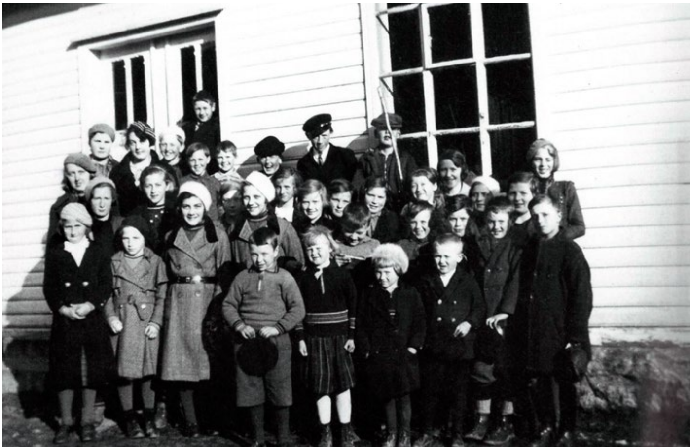
Kilde: "Fastlands Karmøy- Gamle glimt, Bind 1"