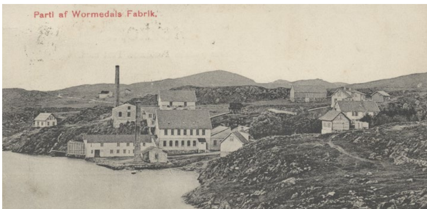
Vormedals Uldvarefabrikk, postkort 1908.

Vormedals nye fabrikkers utsalg Eneste spesialforretning i Uldvare. Gjør deres indkjøp i Vormedals nye Fabrikkers utsalg. Strandgaten 136