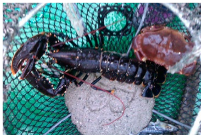
Drømmen on hummaren.

E det ein drøm eller er det muligt å få t? Trur det e mongen som e enige, at ska me beholda goe løysningar som jere livet lettare og tryggare for dei eldre, så må me jera nåke sjøl her på fastlandet. Og det må vara på ein måte der me ikkje blir ein post i salderingsbokå. Tenk om drømmen kunne bli verklige? Dei trengje vår støtte, dei som sloss kvar dag og ytra sine meiningar, for beslutningar som folkevalde e ansvarlige for.