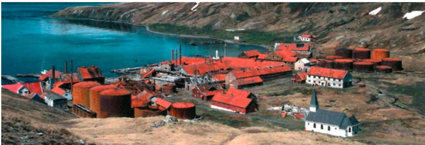
Hvalfangststasjon i dag.