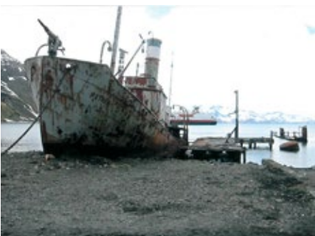
Skipsvrak etter hvalfangsttida.