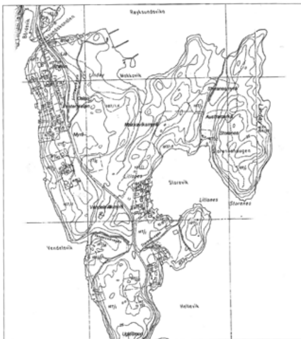
Figur 1. Kart over Lindøy med stadnamn som er brukte i teksten. Eit rute på kartet tilsvører 500 m i terrenget.

Lindøy er egentleg ikkje ei øy, men ei halvøy som er knyta til Fosen med eit smalt eide (om lag 50 m breitt) ved Uglesmog. Lindøy ligg på sørsida av Røyksundkanalen- kjem du frå nord og kryssar brua, er du på Lindøy. Du kjem til friluftsområdet ved å ta av for tunnelen og