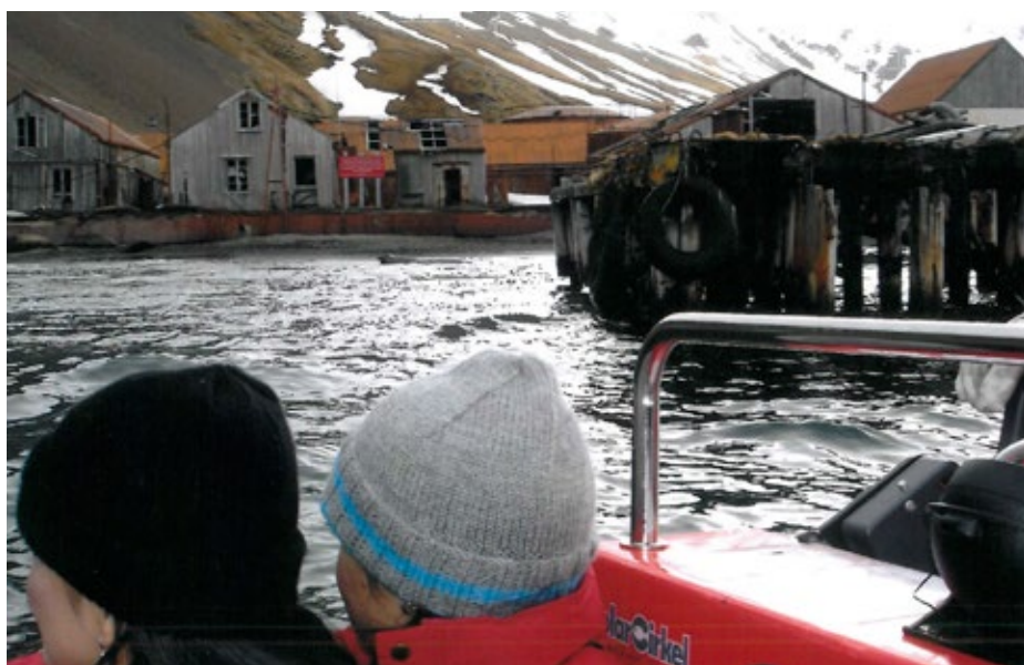
Utflukter gikk ved hjelp av mindre båter.

Endelig er dagen kommet for å bli ilandsett i Grytviken. I dag skulle det også bli den fineste dagen hittil, stille og lettskyet vær med sol utpå dagen. Etter frokost klokken 07.30 ble vi fraktet til land for å besøke den norske (argentinske) hvalfangststasjonen, som ble opprettet i 1904 av nordmannen Carl Anton Larsen. Larsen hadde tidligere drevet nebbhvalfangst i Nordishavet. Han ble, i 1892-93 og 1893-94 med selfangeren "Jason", sendt sydover til de vest antarktiske øygruppene for