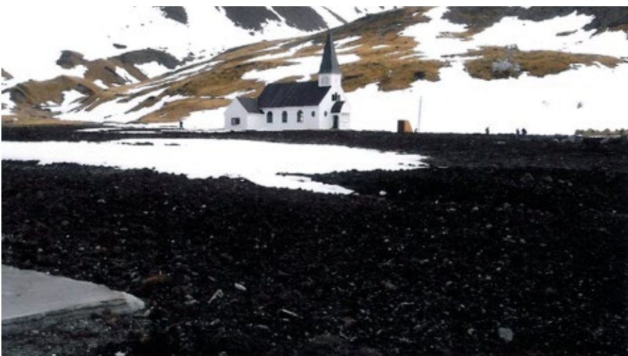
Verdens sørligste kirke.