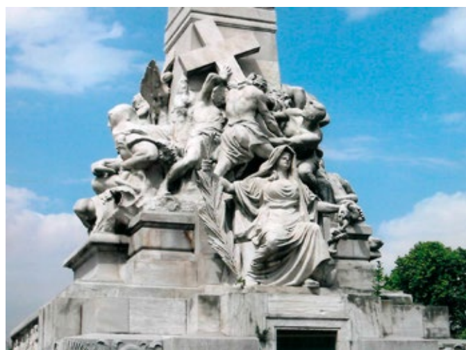
Mange flotte skulpturer i Argentina.

Det rike slettelandet, pampas har store kornåkrer og ypperlige beiteforhold for landets store kvegflokker. Området utgjør Argentinas økonomiske kjerneområde. Omkring 90% av den argentinske befolkningen regnes som etterkommere av europeere, de fleste spansk og italiensk opprinnelse. Argentina ble kolonisert fra Spania i første halvdel av 1500 tallet og fikk ikke sin uavhengighet fra Spania før i 1816. Argentina gjør krav på en sektor av Antarktis og Falklandsøyene.