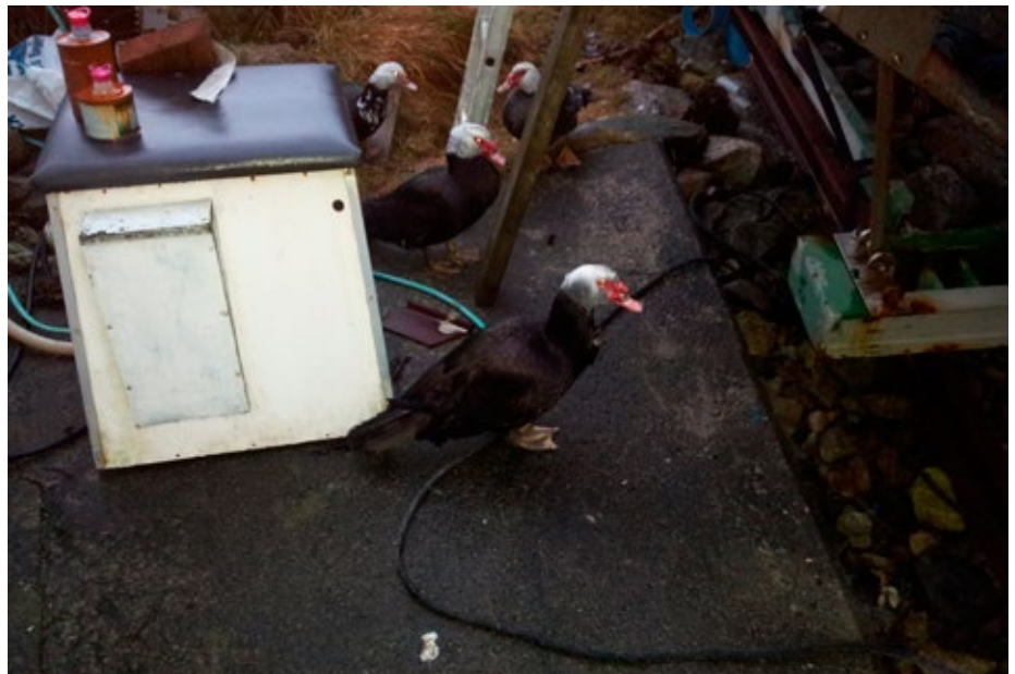
Besøk på slippen.

Å du allverden for arbeid som venta. Alt ska gjerast i denna måneden, som har med vidare årstid å gjera; klargjøring av båtar for å nevna nåke. Hagen skrike itte å bli stelt med. Rydding både inne og ute og ikkje for å glømme mulighetene som lyset ellers gir. Klokkå e stilt ein time fram. Middagskvildå blir korta inn. Bruk påskeferien ute! (Den va t meg sjøl og, for d gir så enorme gevinst og få d med seg. Då e d tur til Boknafjedlet longfredag og så e d Ryvarden 1. påskedag). Ellers så ska me feira påsken på Gjeldsbu. Og så e d viktig å gjera d eg har lova andre.