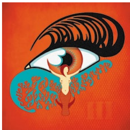
Coverart - D'accord, Third.

«Som grafisk designer er det ikke viktig