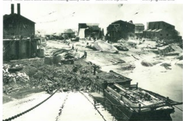
Hvalfangststasjon Leith harbour.