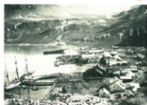
Below: Leith Harbour. Whales are being cut up on the pier and others are waiting in the water. About 25 whales could be processed in one day (1912).

Larsen's company, Compañía Argentina de Pesca (Pesca for short), was soon joined by other companies. These were British and Norwegian owned but, as at all stations in the Antarctic, the business of whaling was carried out mainly by Norwegians. Whaling stations were established at Ocean Harbour, Godthul, Husvik, Strømsnes, Leith Harbour and Prince Olav Harbour. Godthul was the base for a floating factory rather than a shore station. A floating factory was an