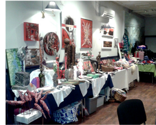
Stor juleutstilling av hjemmelagde produkter