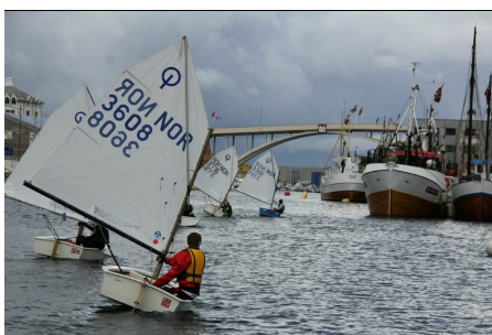
Klubbregatta i Smedasundet for jolleseilerne