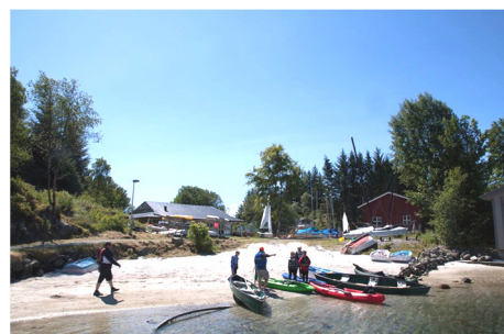
«Gøy på vannet»