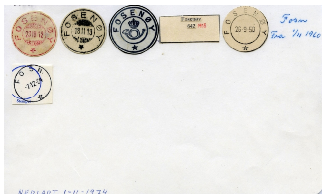
Poststempel Fosenøy