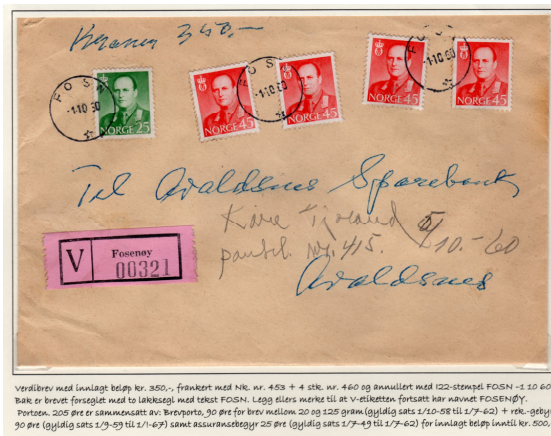
Verdibrev med innlagt beløp 350,-

Fra 1842 ble mange landhandlere utnevnt til poståpner, og i 1871 bortfalt plikten til å være poståpner for de tidligere nevnte embetsmenn, tjenestemann og gjestgivere. I 1909 ble fagforeninga Poståpnerens Landsforbund stiftet. Fra 1913 fikk de regulær lønn, og i tiden 1945–1960 var det omkring tre og et halvt tusen poståpnerier i Norge.