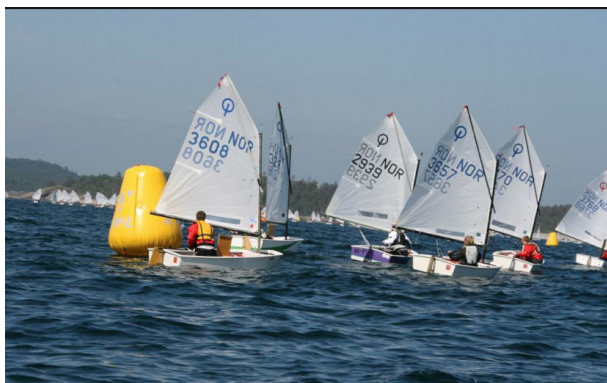
NC i Arendal – et av årets mange høydepunkt.

Ekstra gledelig er det at klubben i tillegg til en aktiv gjeng med litt mer erfarne seilere også har en stor og lovende nybegynnergruppe. I år har totalt åtte helt ferske seilere gjort en stor innsats for å lære seg å mestre Optimisten, og de vil forhåpentligvis sikre høy aktivitet i jollegruppen i mange år fremover.