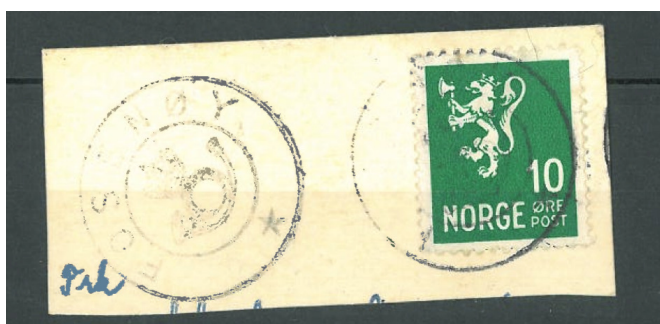
Fosenøy kronet posthornstempel