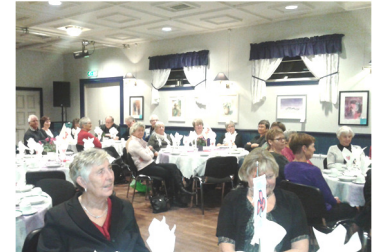
Saniteten inviterte hele bygda på julekos