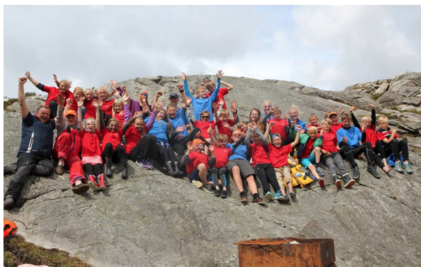
Sommerleiren «Gøy på vannet» har blitt så populær at den i år ble arrangert over to uker.