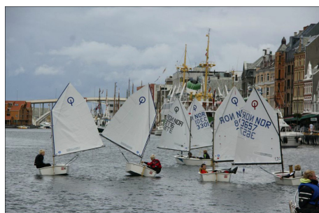
Klubbregatta i Smedasundet for jolleseilerne under Havnedagene i Haugesund.