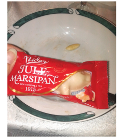
Mandel i grøten og marsipangris til den heldige finneren